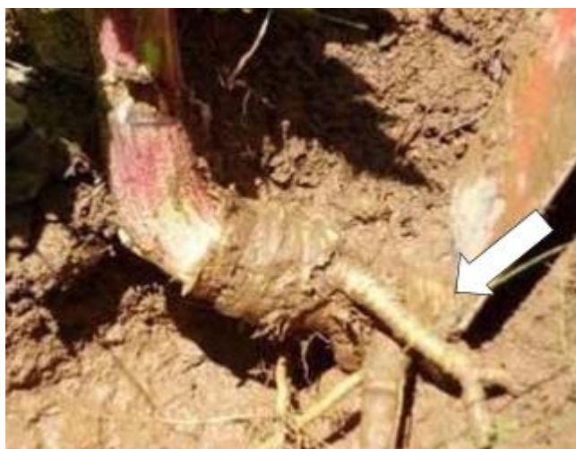
Рисунок 5 – Подрезание растений

Если растение не погибло, необходимо еще раз его подрезать при возобновлении роста. Перерубленные части растений либо уничтожают, либо оставляют высыхать. Этот метод очень эффективен, но он требует больших затрат труда и рекомендуется только в тех случаях, когда мы имеем дело с единичными растениями или небольшой популяцией (до 200 растений).