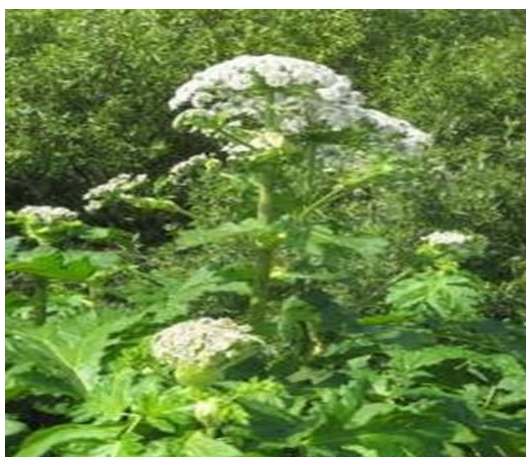
Рисунок 3 – Цветущие растения

Соцветие борщевика называют зонтиком (рисунок 3). После формирования семенного потомства цветоносный побег отмирает совместно с подземной частью растения и корневой системой (рисунок 4).