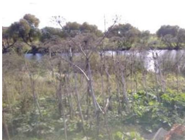
Рисунок 4 – Высохшие стебли

переходят к цветению растения после образования семян в конце лета в начале лета отмирают