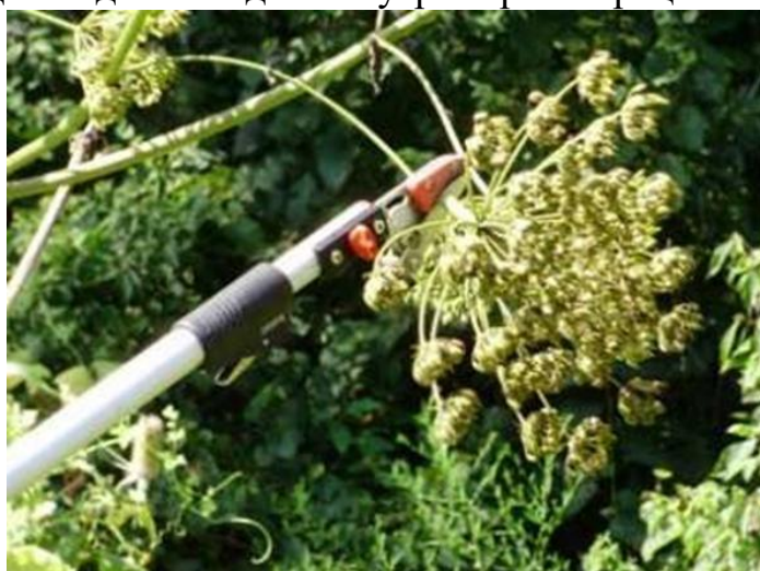
Рисунок 6 – Удаление цветоносов

3. Одним из методов борьбы с борщевиком Сосновского является срезание цветущих растений во время цветения. Борщевики размножаются только семенами. С учетом их высокой семенной способности, удаление цветущих растений должно рассматриваться как первоочередная мера борьбы с борщевиками, особенно одиночными экземплярами. Для удаления побегов можно использовать секатор-сучкорез на длинном шесте, что позволяет удалять цветоносы без контакта с растением (рисунок 6). Уничтожение соцветий может быть также эффективно, как и уничтожение растений целиком, но часто этот метод не дает нужного результата. Растения быстро регенерируют, у них появляются новые соцветия, и они успевают произвести семена. Решающую роль здесь играет время срезания, поскольку, если начать слишком рано (до того, как они полностью расцветут), регенерация будет очень сильной, и семян будет произведено даже больше, чем обычно. Если начать позже (когда уже вызревают семена), велик риск того, что семена созреют в уже срезанных растениях и останутся лежать в земле. Поэтому срезанные растения необходимо уничтожить. Самое подходящее время для удаления соцветий – когда крайние цветки начали распускаться. Однако даже тогда есть угроза регенерации.