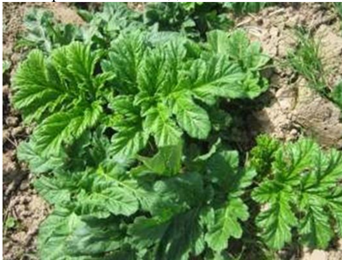
Рисунок 2 – Розетка листьев

стеблекорня трогаются в рост. Как только сойдет снежный покров, на поверхности почвы появляются плотно сложенные вдоль жилок, верхушки первых двух листьев, затем появляются 3-й и 4-й листья (рисунок 2). К концу мая обычно первый лист желтеет и отмирает, появляется 5-й лист. В начале августа у растений начинается активный рост 3-й тройки листьев, которые продолжают ассимилировать вплоть до появления снега.